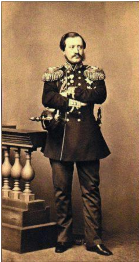
Николай Павлович Игнатъев

от Посъета до Поворотного мыса, вёрст на 200, изобилует прекрасными заливами и гаванями, столь привлекательными для морской державы, что англичане (если бы это оставалось китайским) всё захватили бы, тем более что в 1855 г. они все эти места видели, описали и даже карты издали». Именно это обстоятельство заставляло Россию проявить максимум усилий, как в военном, так и дипломатическом плане. Именно Муравьев-Амурский будет автором идей строительства Транссибирской железнодорожной магистрали и создания Тихоокеанского флота. Все эти идеи реализуются в среднесрочной перспективе.