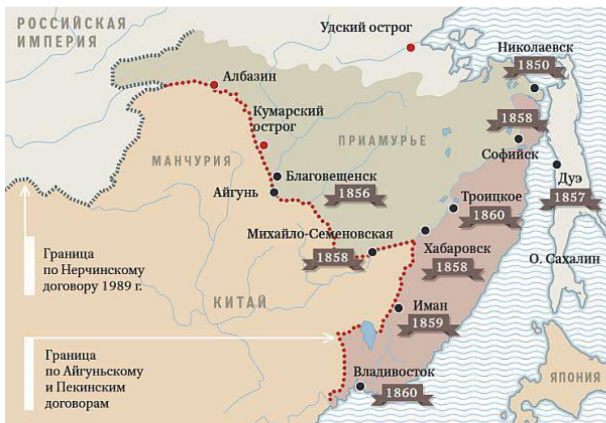
Граница между Россией и Китаем по Айгуньскому и Пекинскому договорам

Пекинский трактат, подписанный в тайне от наших «западных партнеров» был одним из колоссальных успехов русской геополитики и большой неожиданностью для англичан. Усиление России в Китае и установление контроля над Японским морем существенно нарушило планы Великобритании и Франции. Известно, что захватывая китайские территории, англичане планировали зимой 1860 г. высадить десанты для занятия пролива Посьет, который находится вблизи Владивостока. Как показала история опасения и прогнозы Н.Н. Муравьева-Амурского были совершенно справедливы. Россия смогла опередить англичан всего на пару месяцев. 2 октября 1860 г. к берегам Китая подошла сводная русская эскадра из Средиземного моря, взяв под охрану новые русские земли и прикрыв Владивосток. В такой ситуации англичане сразу отказались от идеи с морским десантом. Борьба за влияние в регионе мировых держав вступила в новую фазу. Поняв, что побережье Японского моря для Англии потеряно, наши «западные партнеры» сконцентрировали свои усилия на создании среднесрочных и