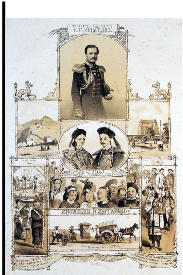
К заключению Пекинского договора 1860 г. Рисунок из Русского художественного листка. 1861 г.